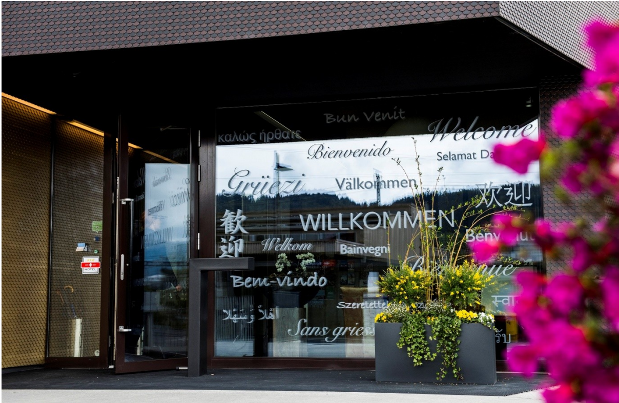
Im Eingangsbereich werden die Gäste in 20 verschiedenen Sprachen begrüßt und das moderne Netz im Treppenhaus des Hotels leuchtet neu in blau.